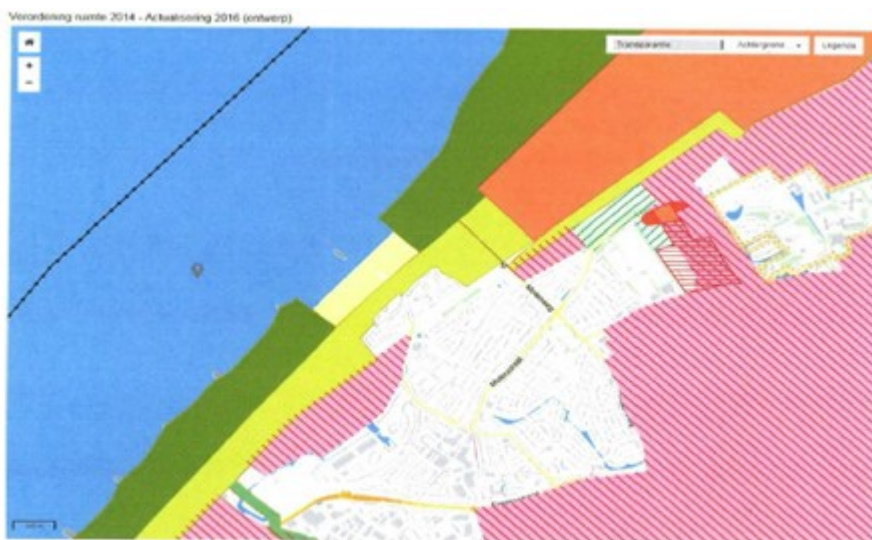
Kaart 3 VRM