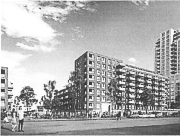
Arcade verzorgt de 178 sociale huurwoningen in de Schoone Ley.

“Wij kregen toen de vraag vanuit het college of we meer wilden bijdragen.” Arcade had de financiële slagkracht om er een schepje bovenop te doen. Bovendien waren in de thuisbasis, het Westland, de uitbreidingsmogelijkheden opgedroogd. “Normaal hadden we wat meer geïnvesteerd in het Westland, maar er zijn daar de laatste jaren weinig bouwlocaties.”