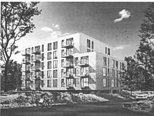
Op de Schapenatjesduin in Kijkduin verrijzen twee gebouwen, samen goed voor zeventig sociale huurappartementen.

De Westlandse corporatie is daar aardig mee onderweg. Zo wordt momenteel de laatste hand gelegd aan De Schoone Ley, een omvangrijk nieuwbouwproject naast het HagaZiekenhuis in Leyenburg. Arcade verzorgt de 178 sociale huurwoningen. Het eerstvolgende project is de Schapenatjesduin in Kijkduin. Op oude sportvelden te midden van het duinbos verrijzen twee gebouwen, samen goed voor zeventig sociale huurappartementen.